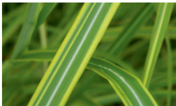
Miscanthus sinensis var. condensatus 'Luc-André Lepage'

Ein Miscanthus mit gelb-grün gestreiften Blättern. Höhe: 1,5 (Blätter) bis 2 Meter. Blüte: weiss. Blütezeit: September bis November. Starkwüchsig. Das Gelb der Blätter ist einzigartig. Züchter: Pépinière Lepage. Einsender: Michel Le Damany, Pépinière Lepage. 22560 Pleumeur Bodou (F).