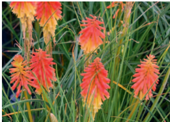
Kniphofia 'Papaya Popsicle'

Eine sehr lang blühende Fackellilie. Blüte: zweifarbig, orange/gelb. Blütezeit: Juli bis September, wenn abgeblühte Blüten entfernt werden, bis zum ersten Frost. Gesundes Laub. Höhe: 50 Zentimeter. Züchter: Terra Nova Nursery. Einsender: Thon Groenendijk, Allplant, 1742 NV Schagen (NL). Sortenschutz angemeldet.