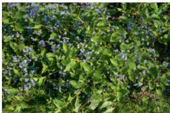
Brunnera macrophylla 'Caucasian Carpet'